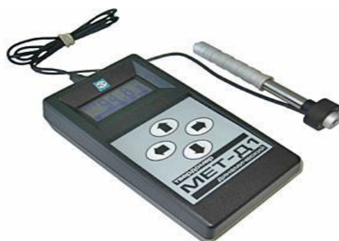
Рисунок 1 – Внешний вид твердомера МЕТ-Д1

Внешний вид твердомера МЕТ-Д1 приведён на рисунке 1, схема пломбировки от несанкционированного доступа на рисунке 2.