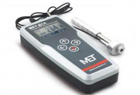
Рисунок 3 – Внешний вид твердомера МЕТ-Д1А