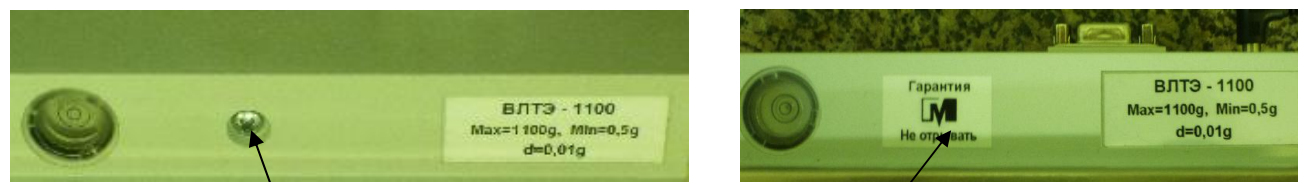
Винт стяжки корпуса

Для защиты весов от несанкционированного доступа, который может привести к искажению результатов измерений, весы пломбируются поверх одного винта стяжки корпуса контрольной этикеткой изготовителя в соответствии со схемой, приведенной на рисунке 2.